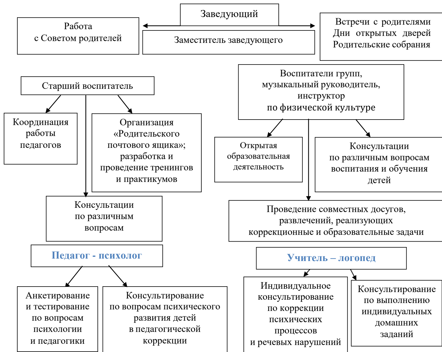
Рис. 1 «Схема взаимодействия с семьями воспитанников»